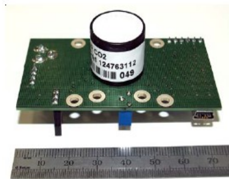
Top view 顶视图